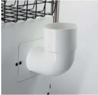
Sortie OZONE orientable Adjustable Ozone outlet

OZONE DISINFECTION : breaks down BACTERIA, FUNGI, MOLD, BAD SMELLS