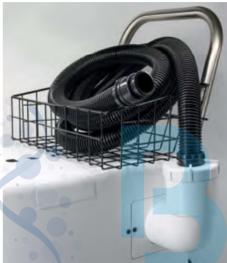
Raccord rallonge OZONE Ozone extension connector