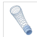
CVK61 (X4) Diffuseur d'air (ressort + manchon)