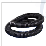
RIP5601 Tuyau air chaud lg 175cm d50mm