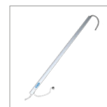
RIP6002 Lampe led 14w