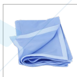
RIP1311 Housse pour matelas simple