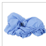
CVK62 Sac de séchage pour siège arrière