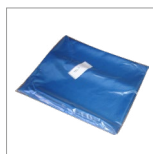
CVK32 (X2) sacs de séchage des sièges avant