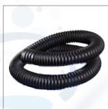
RIP5602 Tuyau air chaud lg 125cm d50mm