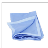
RIP1305 (X2) Sac pour tapis de sol